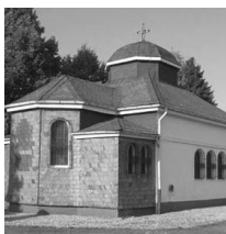
St. Josef Würzburg Dillenburger Str. 39 57299 Burbach

Das Café-Fair und der Eine-Welt-Laden sind donnerstags von 15.00 Uhr bis 18.00 Uhr geöffnet . Hier können Sie fair gehandelte Waren kennen lernen und in gemütlicher Atmosphäre bei einer Tasse Kaffee, Tee oder Kaltgetränken ins Gespräch kommen. Wir freuen uns auf Ihren Besuch. Das Café-Fair finden Sie im kath. Gemeindezentrum Burbach, Fliederweg 4.