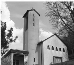
Maria Königin Eisern Rinsdorfer Str. 8 57080 Siegen

kfd 60Plus: Herzliche Einladung zur Maiandacht auf der Eremitage am Mittwoch, 15. Mai , um 15.00 Uhr mit anschließendem Kaffeetrinken im Lokal Eremitage.