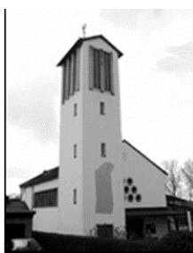
St. Josef Wilgersdorf St-Josef-Weg 2A 57234 Wilnsdorf