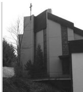
Hl. Kreuz Burbach Fliederweg 4 57299 Burbach