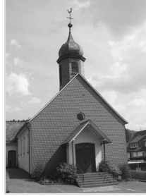
St. Antonius Anzhausen Antoniusstr. 6 57234 Wilnsdorf

Einladung zum ökumenischen Gebet , am Mittwoch, 15. und 29. Mai , jeweils 20.30 Uhr in der evangelischen Kirche Das Gebet dauert knapp 30 Minuten. Eingeladen sind Christen aller Konfessionen. Auch persönliche Gebetsanliegen können mitgeteilt oder im Rahmen des Gebetes ausgesprochen werden.