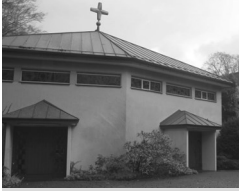
Klosterkirche Eremitage Eremitage 11 57234 Wilnsdorf