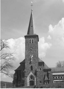
St. Laurentius Rudersdorf Schützenstra- ße 1 57234 Wilnsdorf