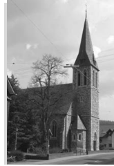
Herz Jesu Niederdielfen Siegener Str. 10 57234 Wilnsdorf