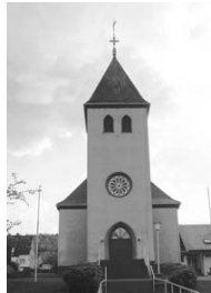
St. Johannes Ev. Gernsdorf St.-Johann-Str. 10 57234 Wilnsdorf

Das Familienzentrum St. Laurentius lädt ein zum Frühlingsfest mit Einweihung des neuen Spielplatzes: Samstag, 25. Mai, 14.00-18.00 Uhr.