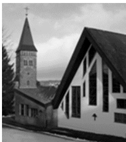
St. Martinus Wilnsdorf St.-Martin- Str. 1 57234 Wilnsdorf