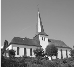
St. Johannes Bapt. Rödgen Höhenweg 6 57234 Wilnsdorf